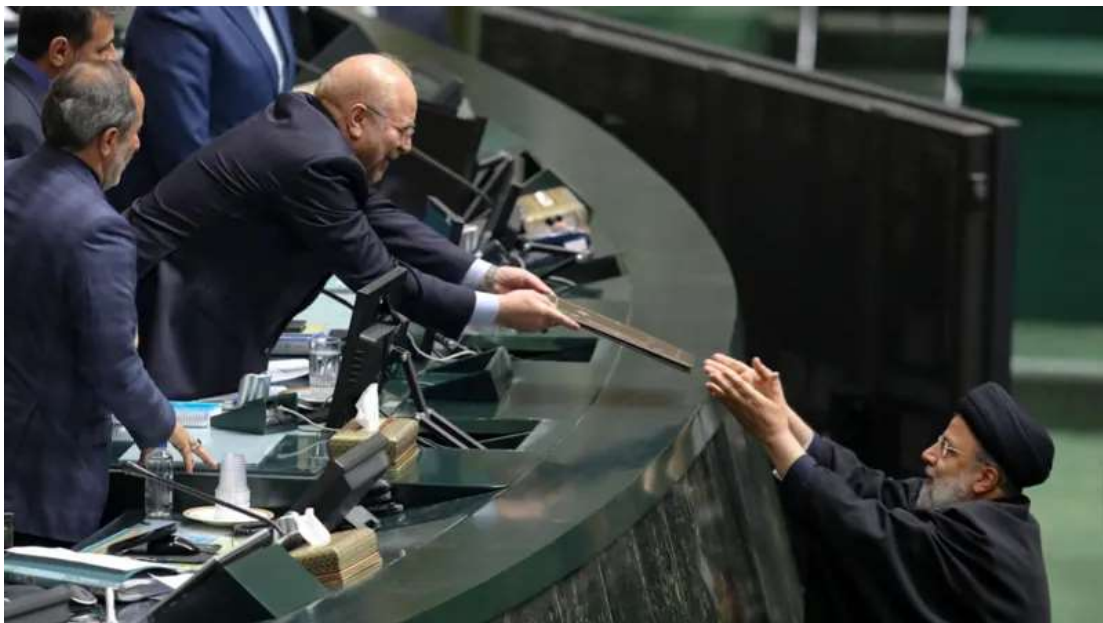
بخش اول بودجه که به مجلس رفته، تنها درآمدهای دولت در سال ۱۴۰۳ را در برمی گیرد

مرکز پژوهش های مجلس ایران در گزارشی: بهرنگ تاج دین خبرنگار اقتصادی بی بی سی فارسی، به گزارش مفصل درباره بخش اول لایحه بودجه سال آینده، هشدار داده که بسیاری از درآمدهای پیش بینی شده در این لایحه محقق نمی شوند، بودجه یارانه ها صدها هزار میلیارد تومان کسری دارد، چشم انداز رشد اقتصادی ضعیف است، و طبقه متوسط فاصله چندانی با خط فقر ندارد.