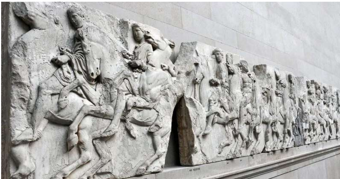
این مجسمه‌ها را لرد الگین از معبد پارتنون در یونان به بریتانیا برد

تنش میان دولت‌های بریتانیا و یونان بر سر تعدادی از زیباترین تندیس‌های یونانی موجود در جهان، در روزهای گذشته شدت گرفته است.