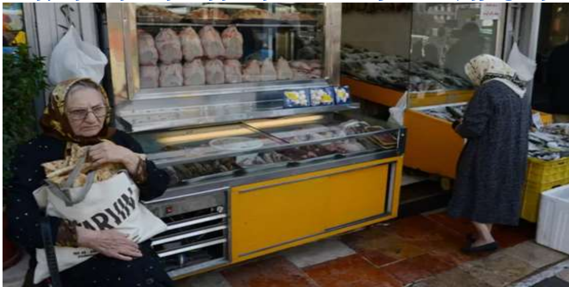
قیمت گوشت و مرغ در یک سال اخیر بیشترین نرخ رشد را داشته است

به نوشته بهرنگ تاج‌دین خبرنگار اقتصادی بی بی سی فارسی با اسناد به آمارهای رسمی در مهرماه امسال گرانی در ایران شتاب گرفت و کسری تراز تجارت خارجی افزایش یافت. طبق بررسی‌های مرکز آمار ایران، نرخ تورم ماهانه از ۲ درصد در شهریور به ۲,۴ درصد در مهر ۱۴۰۲ افزایش یافت. این رقم به این معنی است که کالاها و خدمات مصرفی مردم در مهرماه به طور متوسط ۲,۴ درصد گران‌تر از شهریورماه بود.