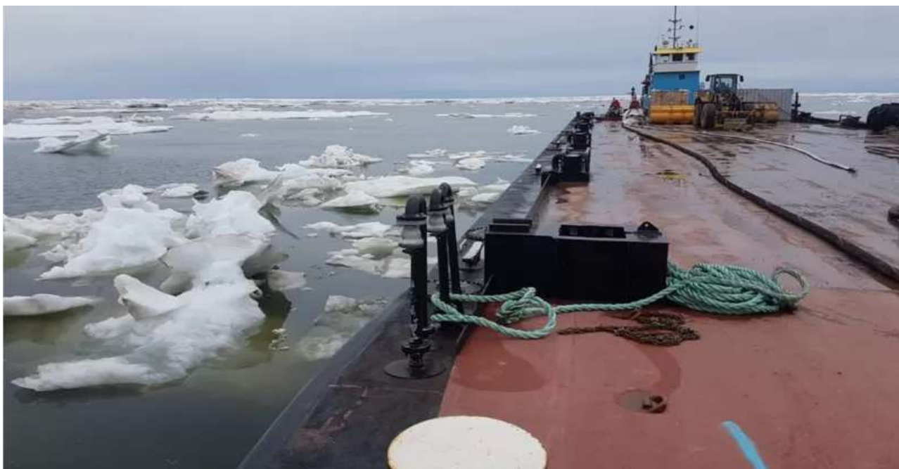
قطعا کسی دوست ندارد کشتی‌اش در اقیانوس منجمد شمالی خراب شود

برای شرکت‌های کشتیرانی حامل کالا از چین یا ژاپن به اروپا یا ساحل شرقی آمریکا، این مسیر کیلومترها راه را کوتاه‌تر خواهد کرد. در حال حاضر حمل این کالاها از طریق کانال پاناما یا کانال سوئز صورت می‌گیرد.