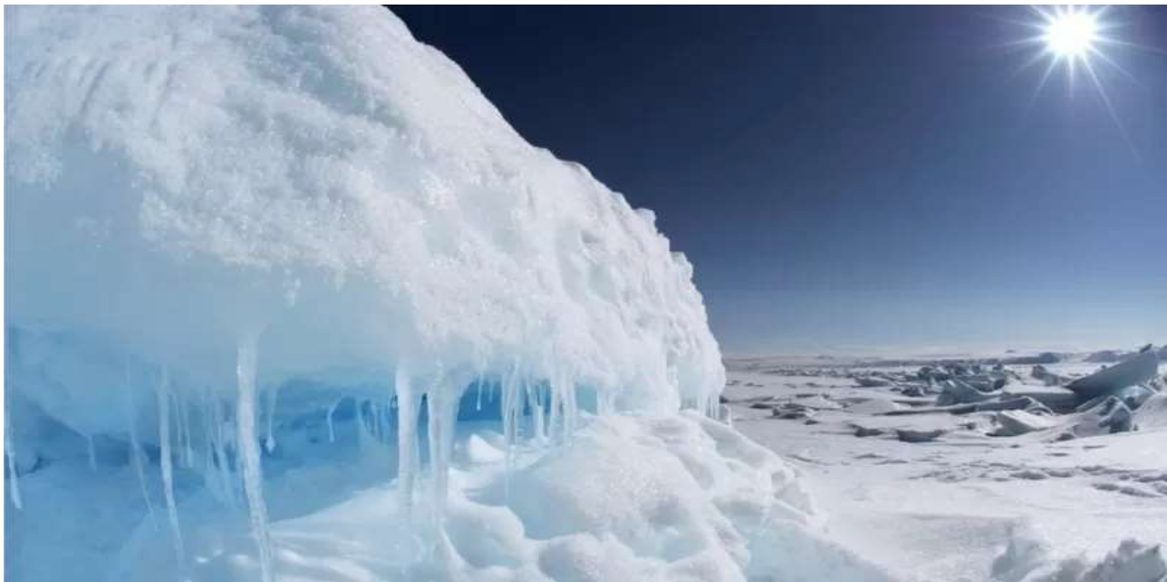
یخ، جدی‌ترین خطر برای کشتی‌های باری در گذرگاه شمال غربی است