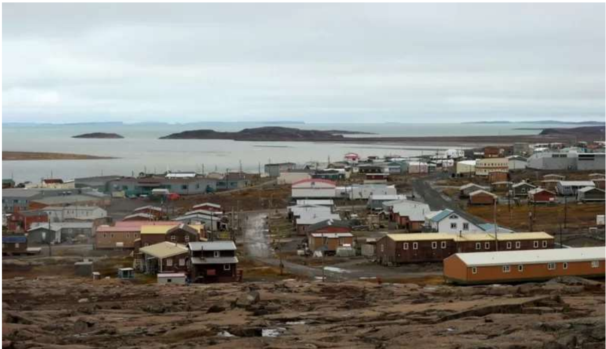
نوناووت در کانادا. به نسبت مساحت، جمعیت کمی در این منطقه اسکان دارد

او می گوید این سفر کمی حوصله اش را سر برده بود- لازم نبود کشتی روزها برای عبور از میان یخ ها تقلا کند.