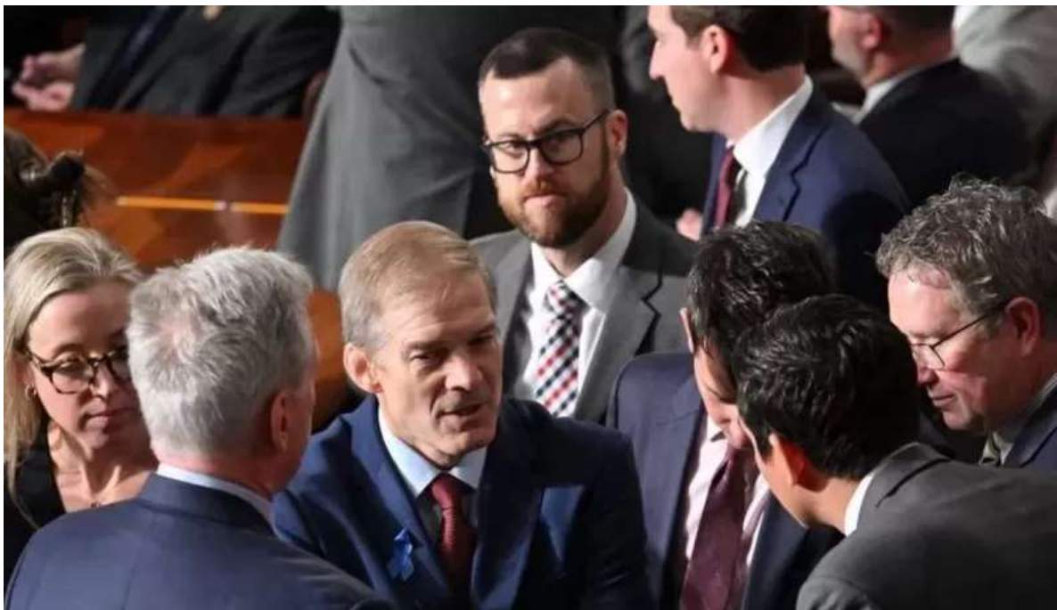
جیم جردن اتهام آزار و اذیت را رد کرده

اعضای جمهوری خواه مجلس نمایندگان آمریکا می‌گویند متحدان جیم جردن، نامزد ناکام ریاست مجلس از این حزب، آنها را هدف شیوه‌های ارباب‌آمیز، از جمله تهدید به مرگ قرار داده‌اند.