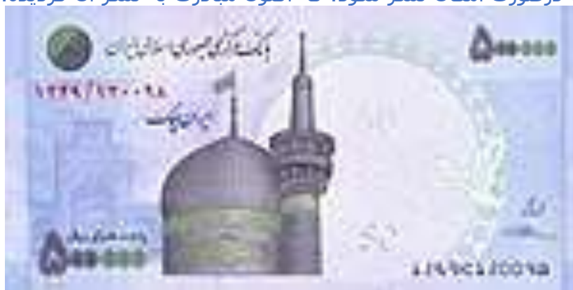
ریال ایران در برابر دلار آمریکا

خبر پژوهشی "نرخ دلار در ایران" که در واقع سیر تحول نرخ دلار در ایران یا روشن تر کاهش قدرت خرید ریال است را خواننده یی برای آگاهی اعضاء اتاق و خوانندگان خبرنامه ارسال داشته و خواسته است در صورت امکان نشر شود، که اکنون مبادرت به نشر آن گردیده.