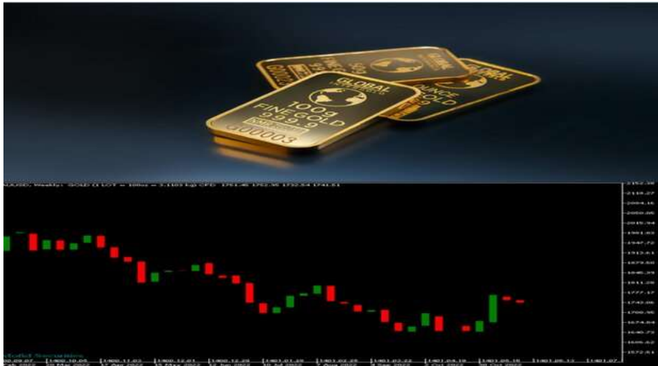
هر انس طلا در ۲ هفته گذشته به زیر ۱۹۰۰ دلار سقوط کرده است

به گزارش خبرنگار مهر، انس طلا در ۲ هفته گذشته ریزشهای عجیب و غریبی داشته و به زیر ۱۹۰۰ دلار نزول کرده در این گزارش به علل این ریزش خواهیم پرداخت: شرایط کاهش ریسک پذیری در بازارهای سهام همچنان ادامه دارد، اما در شرایط پیش بازار، شاخصها در یک موج اصلاحی صعودی در نوسان هستند و احتمال اصلاح صعودی کوتاه مدت تقویت شده است. اما باید شرایط بازار در شروع به کار بازار نیویورک مدنظر قرار گیرد تا واکنش بازار نسبت به اخبار تعطیلات آخر هفته سنجیده شود. انس در ۲ هفته گذشته به زیر ۱۹۰۰ دلار سقوط کرده است، این خبر را در ابتدا کسی باور نمی کرد زیرا همه انتظار داشتند انس یک نفس برای صعود برای فتح قله تاریخی داشته باشد.