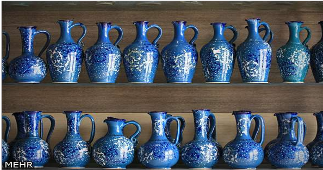
برخی محصولات سفالی لالچین

پس از صرف ناهار از نمایشگاه آثار سفالی لالچین بازدید به عمل آمد و سپس هیات راهی تهران شد. در ساعت ۷ سفر در تهران میدان آرژانتین پایان یافت. لازم به اشاره است که آلبوم کامل عکس های سفر در سایت اتاق قرار خواهد گرفت.