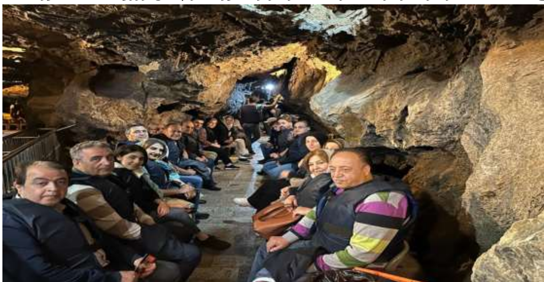
هیات در ورودیه غار، در انتظار ورود به درون غار و نوبت بلمرانی

حدود ساعت ۹ شب تعدادی از اعضا برای بازدید از بازار همدان و سایر آثار و ابنیه دیدنی شهر و صرف شام راهی شهر شدند. صبح روز بعد هیات پس از صرف صبحانه در هتل محل اقامت خود عازم غار علی صدر شد. هیات با ورود به منطقه و محیط غار علیصدر و دو ساعت و نیم بازدید و استفاده از قایق های مستقر در غار برای ناهار در رستوران از پیش رزرو شده حضور یافت.