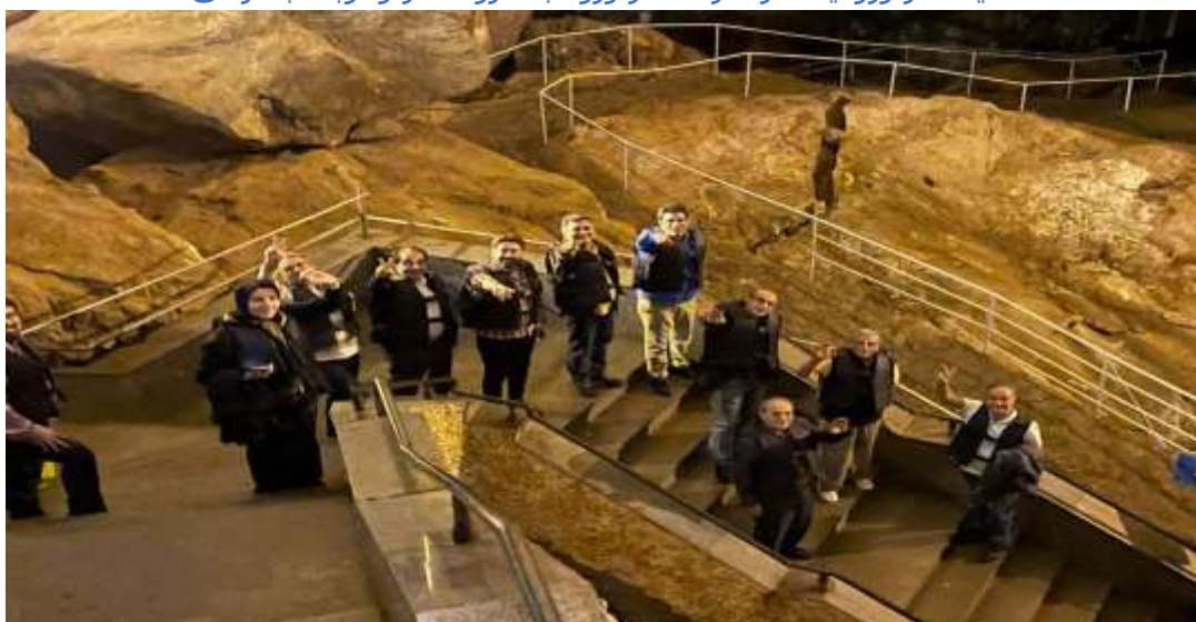
رفت و آمد در درون غار از دو مسیر سنگفرش و پلکانی بالا و پائین رو میسر است در تصویر گروهی از اعضاء هیات در پیچ پله های بالارو در حال تازه کردن نفس می باشند.