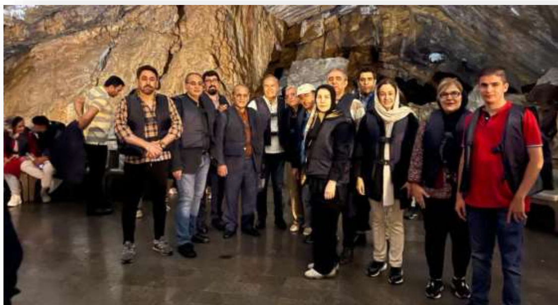
هیات در پایان بازدید و بَلَمَرانی و گشت و گذار داخل غار در انتظار صرف ناهار