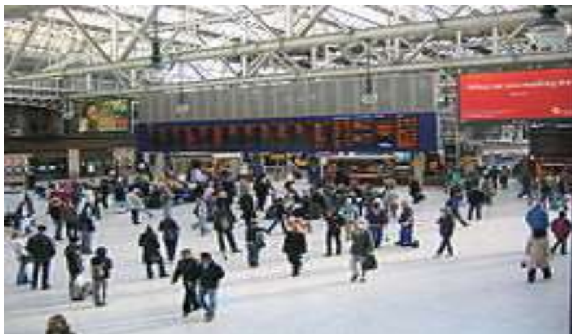
بخش میانی سالن ایستگاه مرکزی راه آهن گلاسگو