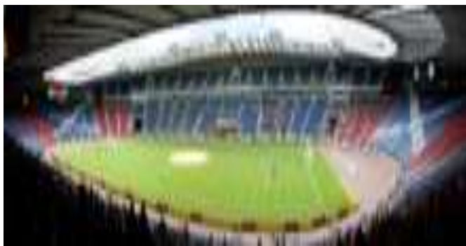
نمایی از ورزشگاه همدن پارک در گلاسگو

اولین مسابقه بین‌المللی فوتبال جهان در سال ۱۸۷۲ بین تیم‌های انگلیس و اسکاتلند در منطقه «پارتیک» شهر گلاسگو انجام شد، که با نتیجه صفر-صفر پایان یافت. گلاسگو، لیورپول و مادرید تنها شهرهای جهانند که هم‌زمان ۲ تیم فوتبال به مسابقه های فینال اروپا فرستاده‌اند. در سال ۱۹۶۷ تیم فوتبال گلاسگو سلتیگ (Glasgow Celtic FC) در فینال باشگاه‌های اروپا (European Cup Final) شرکت داشت و هم‌زمان تیم گلاسگو رنجرز (Glasgow Rangers FC) در فینال جام قهرمانان اروپا (Cup Winners' Cup Final) توپ می‌زد .