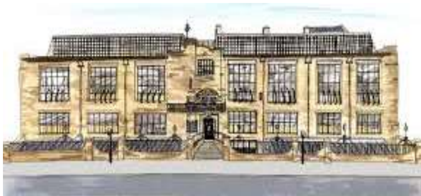
نمای مدرسه هنر

ساختمان مرکزی این مدرسه توسط هنرمند و معمار مشهور اسکاتلندی چارلز رنی مکینتاش (Charles Rennie Mackintosh) طراحی شده است که از فارغ‌التحصیلان همین مدرسه بوده است. پردیس اصلی مدرسه هنر گلاسگو در منطقه گارنت هیل در مرکز شهر گلاسگو واقع شده، و پردیس دوم آن در ساختمان خانه یک هنردوست House of an Art Lover این مدرسه برای علاقمندان به معماری و به طور کلی هنر، از جالب ترین دیدنی‌های گلاسگو است. مجموعه‌ی که در سال ۱۹۰۹ میلادی تکمیل شد. شکوه بنای چشم‌گیر و دیدنی این مجموعه، نشانگر توانایی چارلز مکینتاش در طراحی داخلی و معماری آن می باشد.