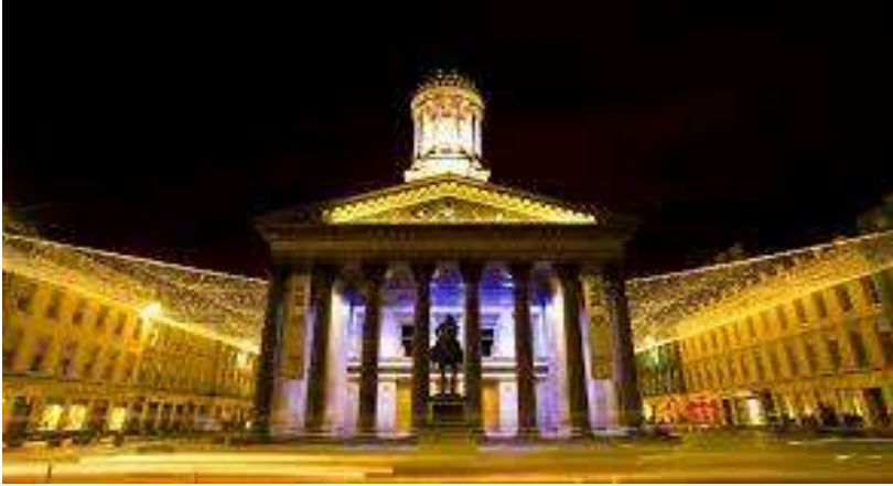
اتاق بازرگانی گلاسگو در میدان جورج

گلاسگو در سده هجدهم به دلیل تجارت با مزارع تنباکو در "ویرجینیا" رونق گرفت. در دهه ۱۷۷۰، سه چهارم کل تنباکوی مصرفی در اروپا توسط بازرگانان ویرجینیایی در گلاسگو دادوستد می شد، اما استقلال آمریکا به این امر پایان داد. از این روبازرگانان گلاسکو تصمیم گرفتند منابع خود را جمع آوری و منافع خود را ارتقاء دهند.