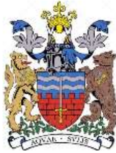
نشان شهر باث