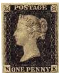
تمبر یک پنسی